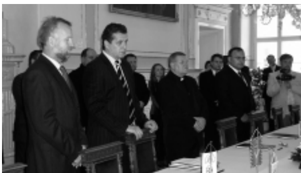
Hostiteľom slávnostného aktu bol nitriansky sídelný biskup Viliam Judák (na snímke tretí zľava).