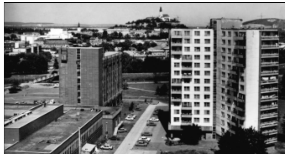
K historickým patrí už aj táto fotografia, zachytávajúca zaujímavú scenériu s pohľadom na vzdialený Nitriansky hrad. Priamo pod nohami vidíme vtedajší Interhotel Nitra (dnes internát UKF) a jeden z 12-poschodových panelákov, rozmáhajúceho sa sídliska Chrenová.