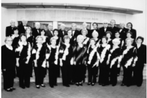
Nitriansky evanjelický spevokol vystúpil na festivale v maďarskom meste Albertiřša, kde sa stretol s pozitívnu poslucháčskou odozvou.