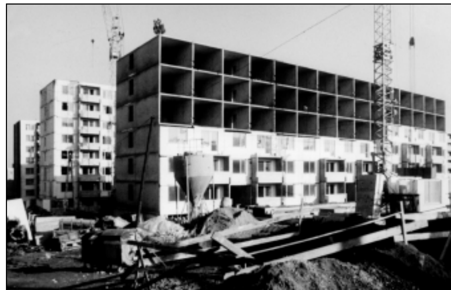
Fotografia s dátumom 8. február 1990 podáva svedectvo o výstavbe posledného bloku na sídlisku Čermáň - stred. Podľa autora snímky Kolomana Zúrika, výstavbu dokončili v apríli toho istého roku a ľudia sa mohli sťahovať do svojich nových príbytkov.